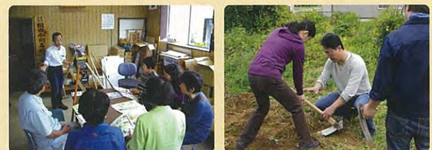
製品安全の意識啓発(ワークショップの開催)

※ 過去の重大製品事故やリコールなどは、本表彰の応募を妨げるものではありません。