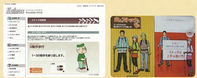
安全に関わる情報の発信(HP・冊子による情報提供)

3 出荷後に安全上の問題が判明した際の取り組み(事故やリコール等が起きた際の取り組み)