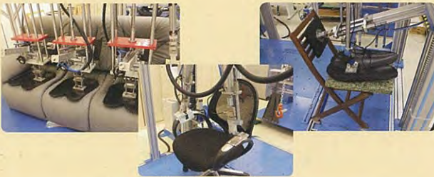
製品の安全性の確認(試験装置による評価)