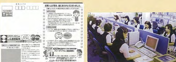
リコール情報の伝達(ハガキ・電話によるフォロー)

3 出荷後に安全上の問題が判明した際の取り組み(事故やリコール等が起きた際の取り組み)