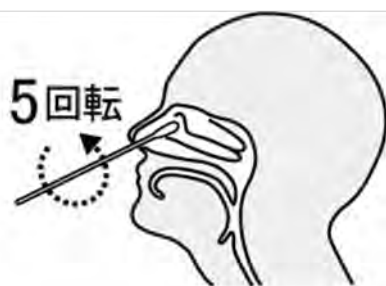
鼻腔ぬぐい液採取